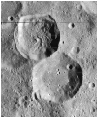
Lunar Orbiter 4 image of the Moon craters Abenezra (upper left) and Azophi (lower right)

6. (ט) עש - הם שצעה כוכבים. כסיל וכימה - שני כוכבים גדולים האחד צפאת שמאל מגלגל הנוטה והשני צפאת נגז ועש צפאת לפון הגלגל הגדול. וחדרי תימן - הם הכוכבים שהם צפאת נגז הגלגל הגדול וצעזור היות היישו צפאת שמאל ולא יראו אותם הכוכבים על כן קראם חדרי כאלו הם במקום נחצה.